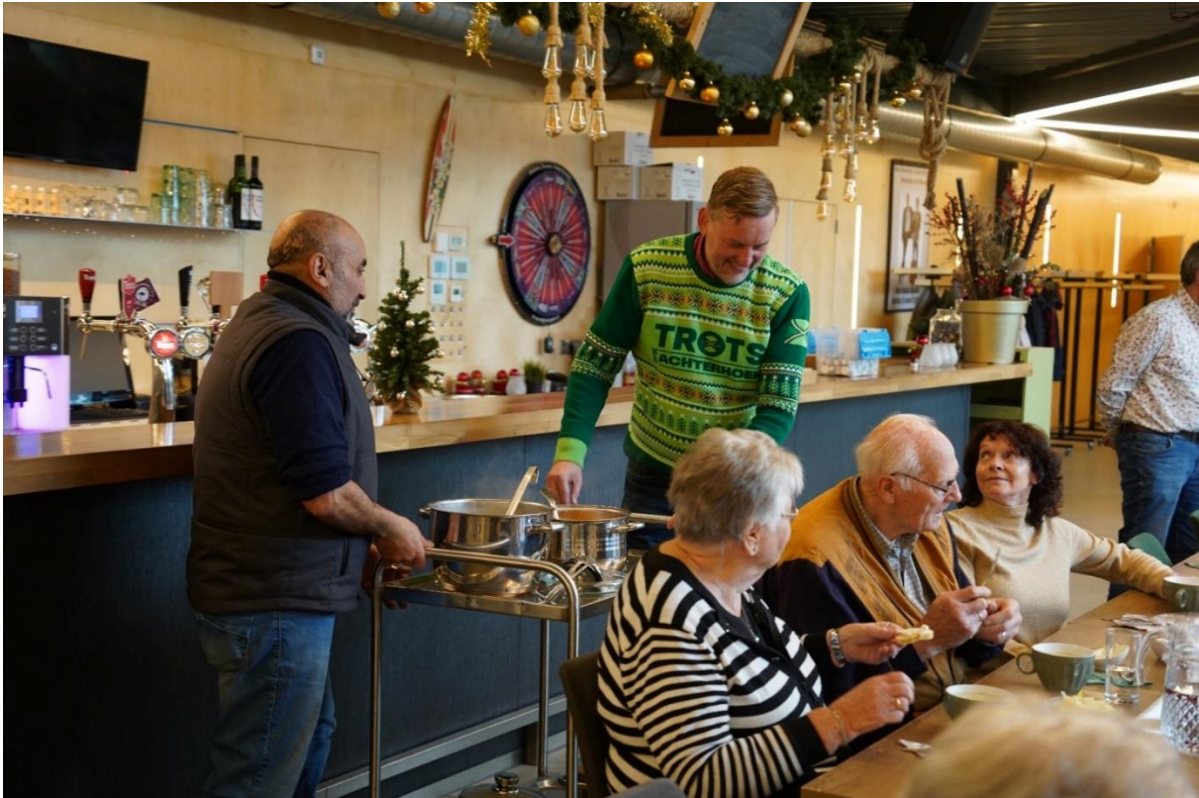
Bij Soep Sociaal helpen regelmatig "bekende Aaltenaren" mee om de soep te serveren!

Deze soep wordt door de vrijwilligers zelf gemaakt. Ook de voorbereiding, zoals het boodschappen doen, doen zij zelf. Inmiddels is er een groep van 10 vrijwilligers die (in wisselende samenstelling) Soep Sociaal draait. Vrijwilligers die afkomstig zijn vanuit het participatiepact, welzijn op recept of 'gewoon' zijn komen helpen omdat ze graag vrijwilligerswerk wilden doen en/of mensen willen leren kennen. Kosten zijn €2,50 per deelnemer die komt eten. Soep Sociaal is een middel om ontmoeting te faciliteren en mensen kennis te laten maken met gezonde voeding.