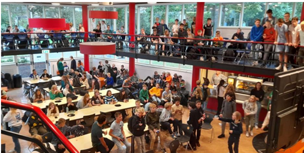
Jongerenwerk op Schaersvoorde

Daarnaast zijn we eind 2023 gestart met een groot project met betrekking tot de jongerenruimte de Kelder. Meer dan 10 klassen op Schaersvoorde Slingelaan zijn betrokken bij invulling van activiteiten, openingstijden, doelgroepen, decoratie e.d..