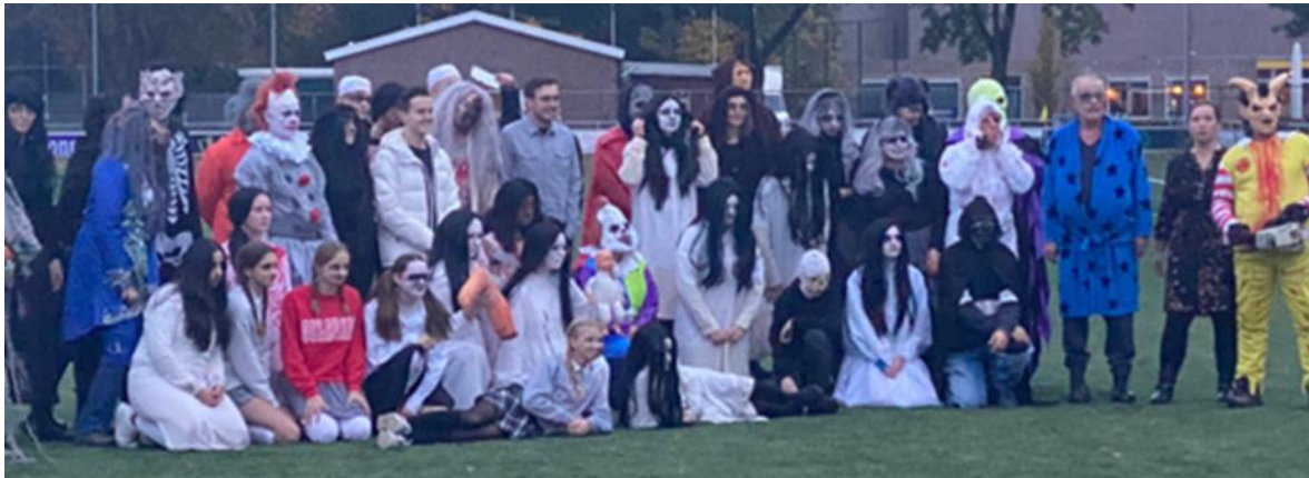
Dinxper heeft lef – Halloween

spannende tocht. Er deden in totaal 246 mensen mee aan de spooktocht. Aan de spooktocht zijn ongeveer 200 vrijwilligers verbonden. Deze vrijwilligers zijn onder andere verbonden aan Figulus, FC Dinxperlo, Optisport Het Blauwe Meer, de Brandweer Dinxperlo en Survivalvereniging Try-Out. De overige vrijwilligers zijn niet per se verbonden aan een vereniging maar dragen wel bij aan de realisatie van de spooktocht.