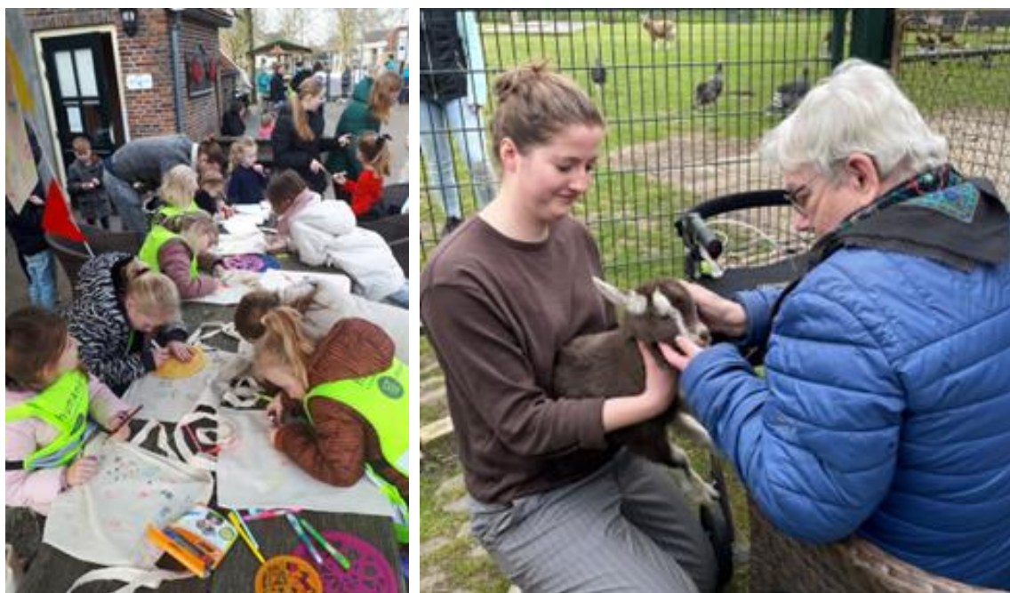
Op de Ahof is altijd wat te doen.....

Voorbeelden van bewonersinitiatieven: bijenstal, kruidentuin, moestuin, meidengroep, samenwerking KDV euroregio Aalten- Bocholt, een sociaal terras, de Formulierenbrigade, Maatschappelijk werk, GRIP team, Klussendienst, boodschappenservice en een uitgebreid aanbod van cursussen en activiteiten.