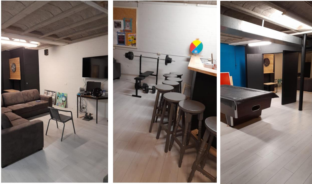
Het eindresultaat: de nieuwe Kelder