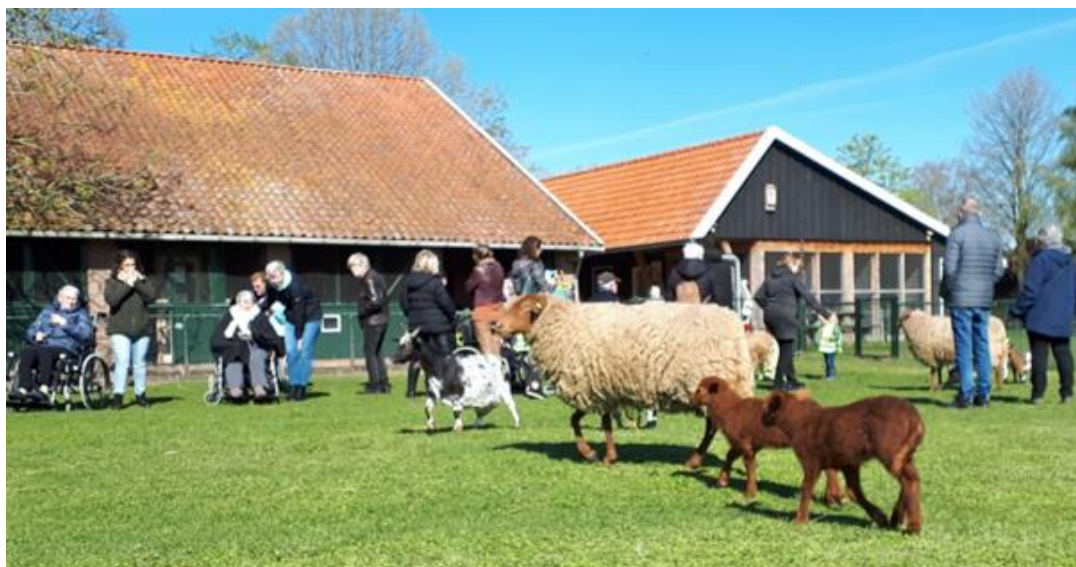
Kroamschudden op de Ahof

Figulus heeft samen met Marga Klompé en Careaz enkele gezamenlijke activiteiten opgezet. Dit was bijvoorbeeld Kraamschudden. Tijdens Kraamschudden kwamen ca. 60 ouderen van Marga Klompé en Careaz op bezoek bij de Ahof, om de pas geboren geiten en schapen te bewonderen en te aaien (Kraamschudden). Onder het genot van een krentenwegge, accordeonmuziek en wol spinnen, was het een prachtige dag. De ouderen hebben genoten van deze dag met de jonge dieren.