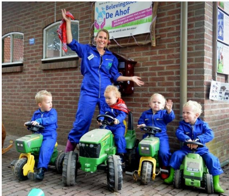
De Kleine Bözzeel

Voor de begeleiding van deze activiteiten is een groep van 3 vrijwilligers aanwezig inclusief 2 stagiaires. Cliënten van Estinea zorgen voor de koffie/ thee voor de ouders en een appeltje gesponsord door Lensink Aardappelen.