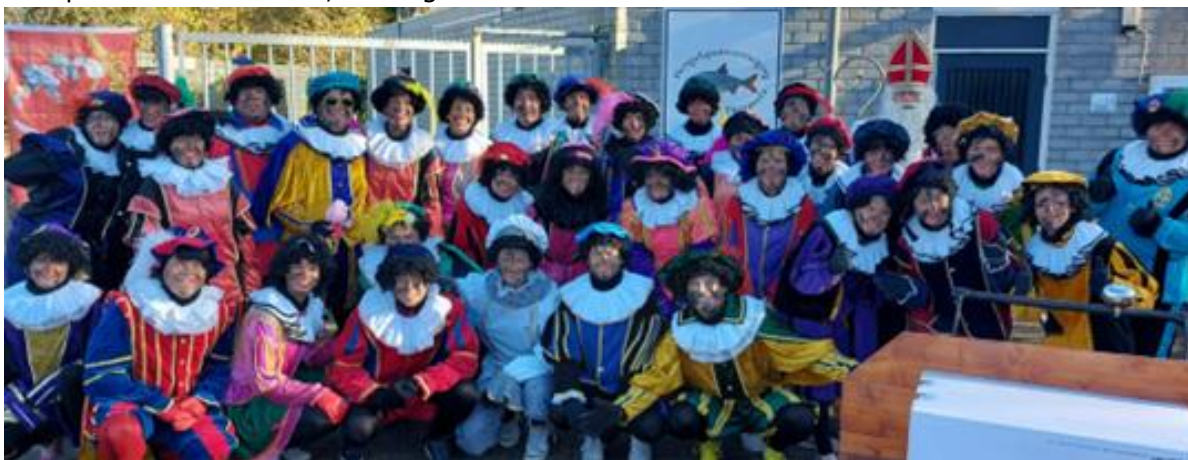
Het sinterklaas team

Gezamenlijk met de ondernemersvereniging OFD organiseren we een intocht in Dinxperlo. Belangrijk is dat we daar veel jongeren en kinderen inzetten om het geheel tot een succes te maken. Met veelal jongeren als vrijwilligers en kinderen die de invulling doen vanuit verschillende verenigingen verbinden we alle partijen. Bij de intocht zijn dus verenigingen en jongeren betrokken met als doel samen iets voor de kinderen uit Dinxperlo aan te bieden, in dit geval de intocht.