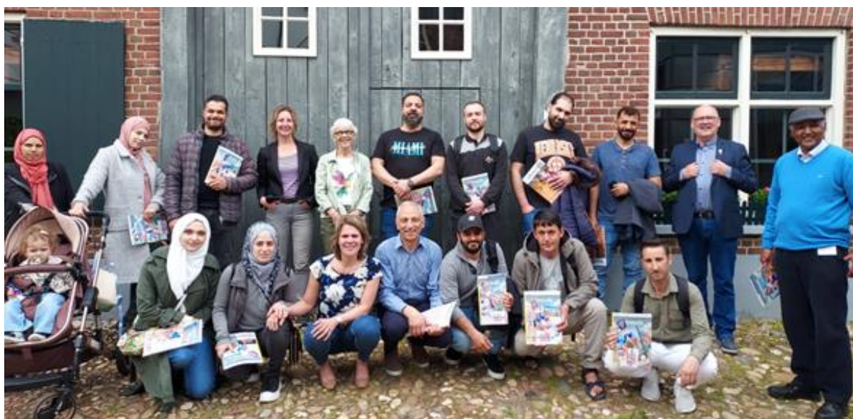
PVT middag in het Onderduikmuseum