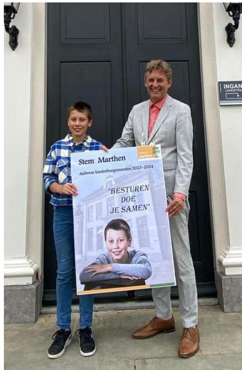
Kinderraad en kinderburgemeester