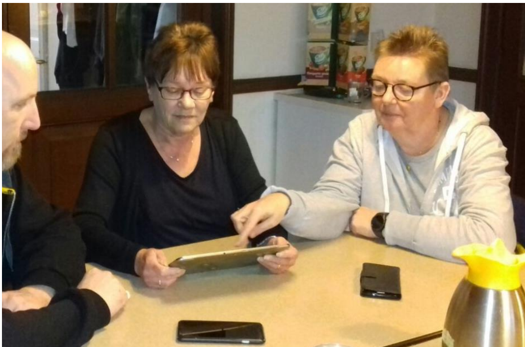
Ons mobiele team