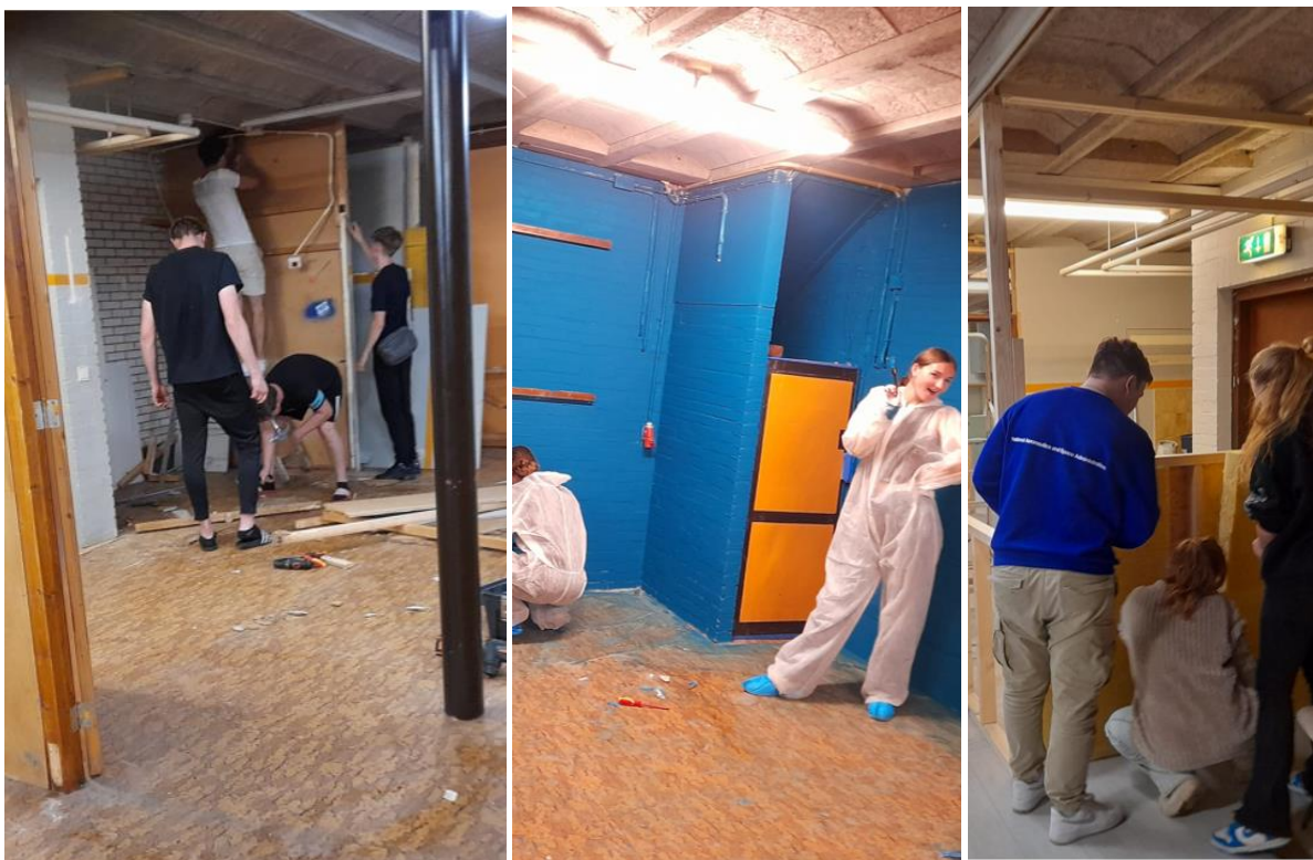
Werk in uitvoering in de Kelder van de Pol

In 2023 zijn we verhuisd van de Ludgerstraat naar de kelder van de Pol. Hier is de afgelopen periode hard gewerkt (ook samen met jongeren!) aan de verbouwing voor een nieuwe jongerenruimte. Tijdens de verbouwing wordt al regelmatig gebruik gemaakt van de ruimte. De ruimte heeft hetzelfde doel als de plek aan de Ludgerstraat, maar is meer geschikt voor de jeugd. Samen met meer dan 10 klassen op Schaersvoorde wordt gewerkt aan een groot project voor de inrichting en decoratie voor deze ruimte. Ook andere leerlingen zijn al bezig met een muurschildering en inrichting. Door sponsoring van verschillende kanten hopen we in 2024 de ruimte af te maken. Sandbox is inmiddels verhuisd naar de Ahof.