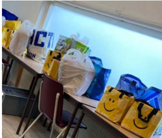
Pakketten i.h.k.v. menstruatie armoede