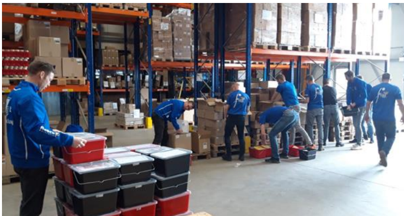
LUVA schoonmaakpakketten voor de voorjaars schoonmaak