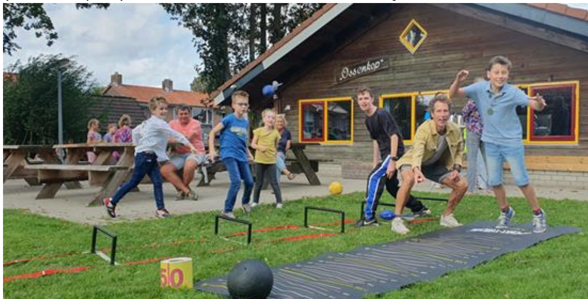
Bewegen in de wijk – door de hele gemeente, hier in Bredevoort

Schaersvoorde, Blichbouw en Figulus zal deze activiteit ook doorgezet worden in 2024 (ook in Dinxperlo). We merken dat er veel animo in de wijk is om deel te nemen.