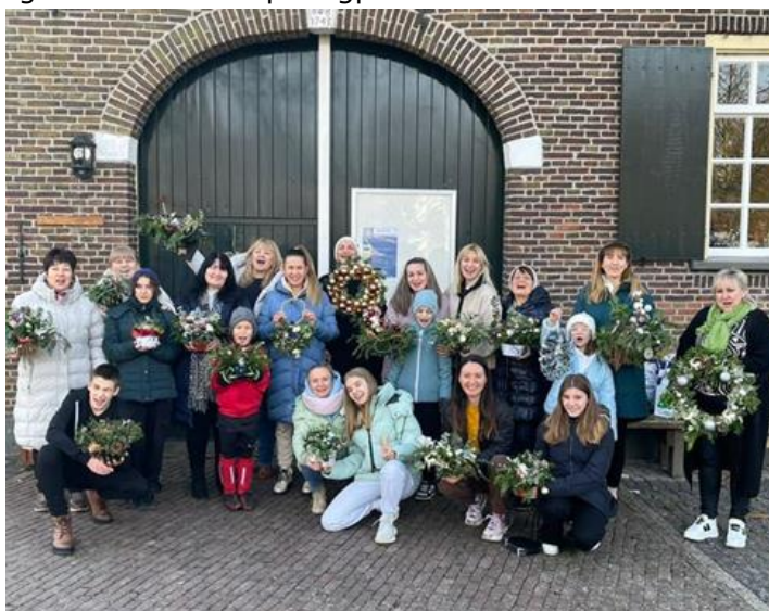
Veel Oekraïners komen bij elkaar op de Ahof. Zowel voor taallessen als ontspanning