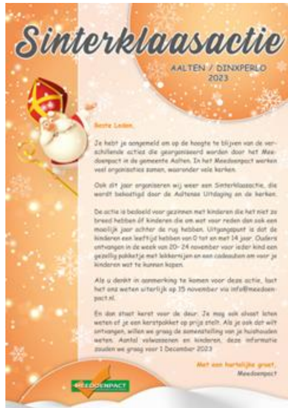
Sinterklaas- en Kerstactie Meedoenpact

Hieronder enkele voorbeelden in 2023 van het Meedoenpact: