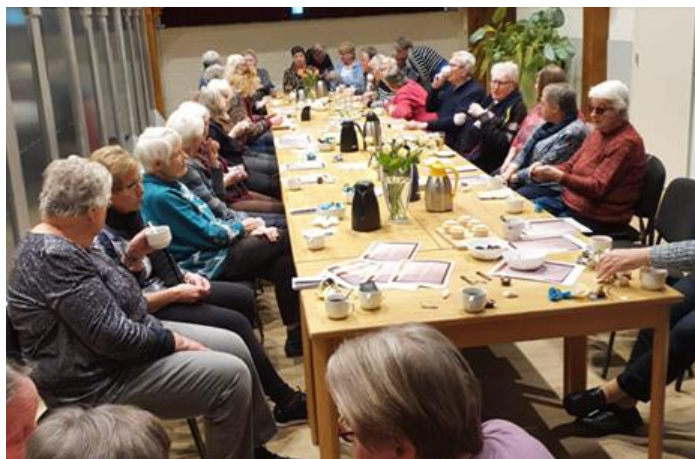
Seniorenfit in Dinxperlo bestond 40 jaar